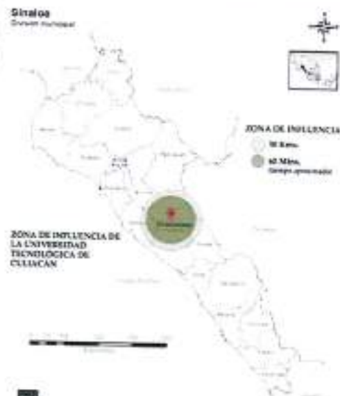
Figura 1. Delimitación de la zona de influencia de la Universidad Tecnológica

En el estado de Sinaloa el 49.8% de la población de 12 años y más corresponde a población económicamente activa, de la cual, el 96.5% se encuentra en estado de ocupación, mientras que un 3.5% se encuentra desocupada.