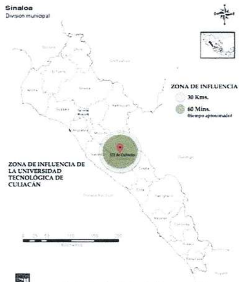
Figura 1. Delimitación de la zona de influencia de la Universidad Tecnológica

En el estado de Sinaloa el 49.8% de la población de 12 años y más corresponde a población económicamente activa, de la cual, el 96.5% se encuentra en estado de ocupación, mientras que un 3.5% se encuentra desocupada.