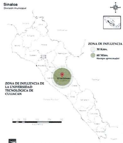
Figura 1. Delimitación de la zona de influencia de la Universidad Tecnológica

En el estado de Sinaloa el 49.8% de la población de 12 años y más corresponde a población económicamente activa, de la cual, el 96.5% se encuentra en estado de ocupación, mientras que un 3.5% se encuentra desocupada.