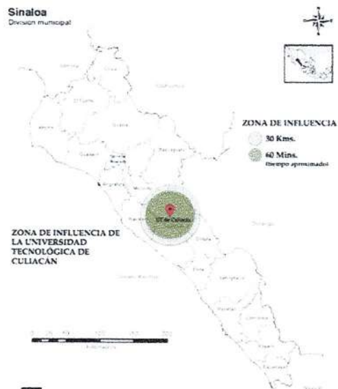
Figura 1. Delimitación de la zona de influencia de la Universidad Tecnológica

En el estado de Sinaloa el 49.8% de la población de 12 años y más corresponde a población económicamente activa, de la cual, el 96.5% se encuentra en estado de ocupación, mientras que un 3.5% se encuentra desocupada.