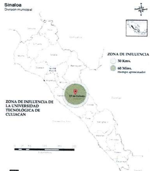
Figura 1. Delimitación de la zona de influencia de la Universidad Tecnológica

En el estado de Sinaloa el 49.8% de la población de 12 años y más corresponde a población económicamente activa, de la cual, el 96.5% se encuentra en estado de ocupación, mientras que un 3.5% se encuentra desocupada.