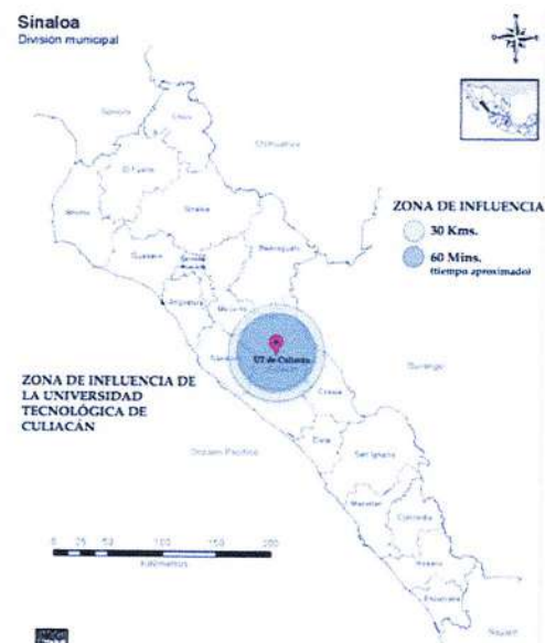
Figura 1. Delimitación de la zona de influencia de la Universidad Tecnológica

Alcanzar el futuro deseado de la Universidad Tecnológica de Culiacán (UTCULIACÁN) requiere la realización de un ejercicio de planeación en términos de