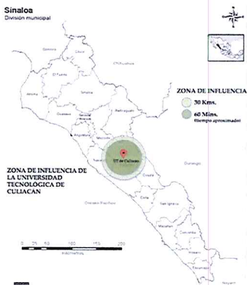
Figura 1. Delimitación de la zona de influencia de la Universidad Tecnológica

En el estado de Sinaloa el 49.8% de la población de 12 años y más corresponde a población económicamente activa, de la cual, el 96.5% se encuentra en estado de ocupación, mientras que un 3.5% se encuentra desocupada.