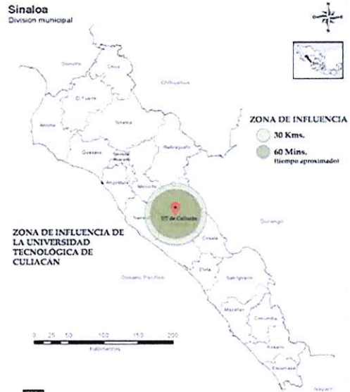
Figura 1. Delimitación de la zona de influencia de la Universidad Tecnológica

Alcanzar el futuro deseado de la Universidad Tecnológica de Culiacán (UTCULIACÁN) requiere la realización de un ejercicio de planeación en términos de coherencia y consistencia entre los objetivos, las metas, las estrategias y las acciones y se evalúen sus resultados propuestos.