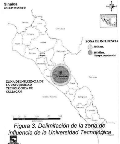
Figura 3. Delimitación de la zona de influencia de la Universidad Tecnológica

Alcanzar el futuro deseado de la Universidad Tecnológica de Culiacán (UTCULIACÁN) requiere la realización de un ejercicio de planeación en términos de coherencia y consistencia entre los objetivos, las metas, las estrategias y las acciones y se evalúen sus resultados propuestos.