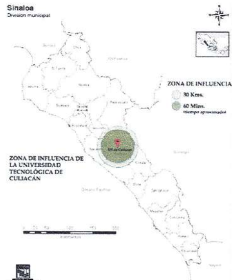
Figura 1. Delimitación de la zona de influencia de la Universidad Tecnológica de Culiacán

La delimitación de zona de influencia establecida para la Universidad Tecnológica de Culiacán abarca los municipios de Culiacán, Navolato, Mocorito y Elota, tomando en cuenta 30 km a la redonda de la ubicación de la UTC, así como el tiempo efectivo de traslado de la población flotante de máximo 60 minutos, esto nos lleva a definir que el municipio de Cósala, aunque es un municipio a menos de 30 km de distancia, en tiempo de traslado sobre pasa las 2 horas por lo que no se contempla dentro de la zona de influencia.