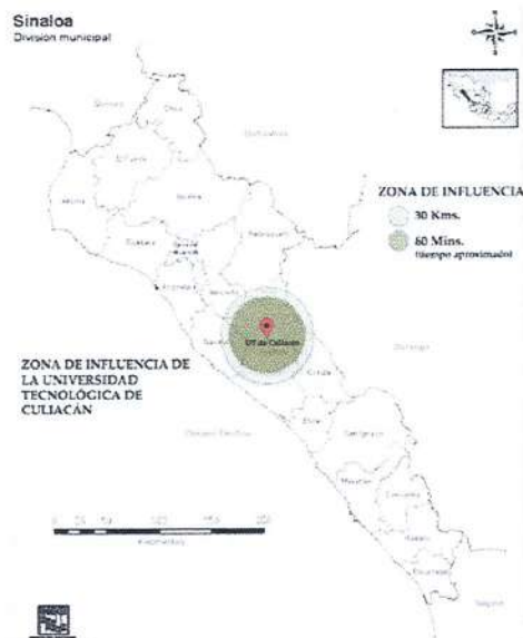
Figura 1. Delimitación de la zona de influencia de la Universidad Tecnológica de Culiacán

La delimitación de zona de influencia establecida para la Universidad Tecnológica de Culiacán abarca los municipios de Culiacán, Navolato, Mocorito y Elota, tomando en cuenta 30 km a la redonda de la ubicación de la UTC, así como el tiempo efectivo de traslado de la población flotante de máximo 60 minutos, esto nos lleva a definir que el municipio de Cósala, aunque es un municipio a menos de 30 km de distancia, en tiempo de traslado sobre pasa las 2 horas por lo que no se contempla dentro de la zona de influencia.