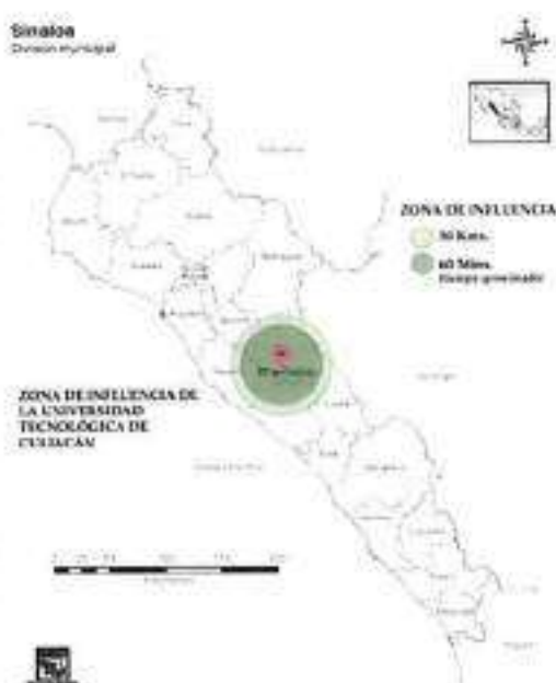
Figura 1. Delimitación de la zona de influencia de la Universidad Tecnológica de Culiacán

La delimitación de zona de influencia establecida para la Universidad Tecnológica de Culiacán abarca los municipios de Culiacán, Navolato, Mocorito y Elota, tomando en cuenta 30 km a la redonda de la ubicación de la UTC, así como el tiempo efectivo de traslado de la población flotante de máximo 60 minutos, esto nos lleva a definir que el municipio de Cósala, aunque es un municipio a menos de 30 km de distancia, en tiempo de traslado sobre pasa las 2 horas por lo que no se contempla dentro de la zona de influencia.